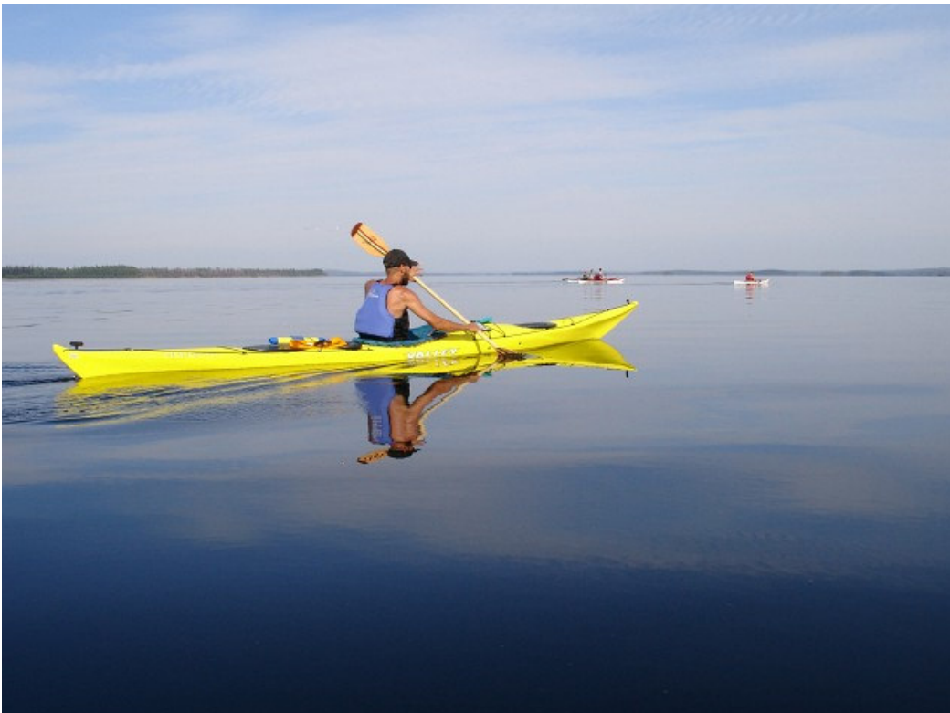
Kalixin meriretki elokuu 2006