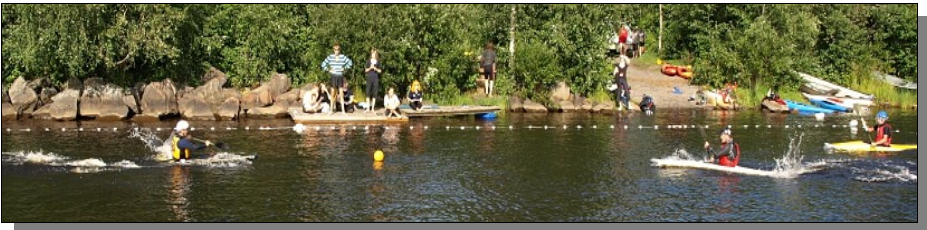
Pelin aloitus Oulupoolo –turnauksessa v. 2008.