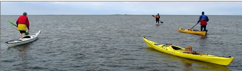
"Melontaretki" Santapankissa v 2007