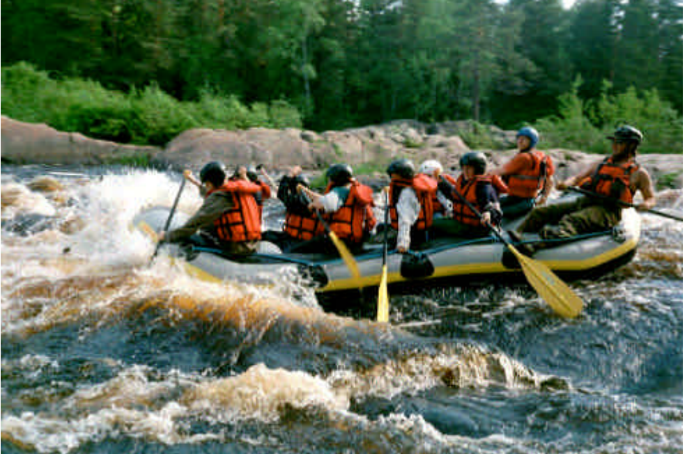
(Kuva: Nuorisoleiriläiset Koitelissa)